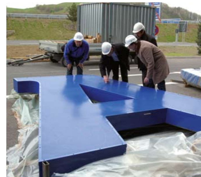
Die AZT Schadenexpertise umfasst das gesamte Spektrum von konventioneller und erneuerbarer Energieerzeugung.